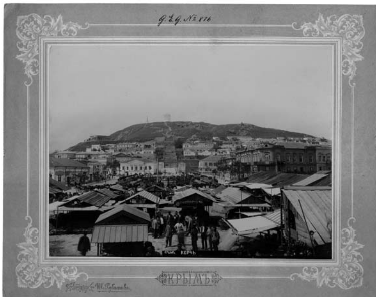
Foto 7. M. Rubantšik. Kertši linn Krimmis. 1890. aastad, kolloodiumfoto, 17,7×23,6 cm, AM F 17616.

20. sajandist kümme fotot Vanemuise teatri ehitamisest (AM F 16927–16926), 15 fotot ERM-i väljapanekutest (AM F 17261–17275), 11 fotot Härgmäe lossist 1910. aastal (AM F 17685–17695), 14 fotot Vönnu Jaani kiriku hauakividest 1912. aastal (AM F 17826, F 18003–18014), kuus fotot 1918. aasta Saksa okupatsioonivägede paraadist (AM F 17927–17933).