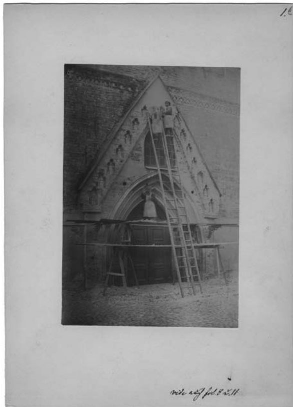
Foto 6. Tuvastamata autor. Tartu Jaani kiriku portaali restaureerimine. Töölised tellingutel. 1899?, kolloodiumfoto, 14,5×9,7 cm, AM F 16977.

Alüksne lossi vaate. 87 1900. aastal annetas ülempastor G. Oehrnschmidt ÕES-i muuseumile mapi Tartu Jaani kiriku läänekülje fotodega (kokku 37 fotot, AM F 16975–16993, foto 6). 88