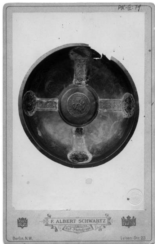
Foto 5. Arheoloogiline leid Viljandi ligidalt – nn keiser Otto kauss. 1886, albumiinfoto, 17,8×11,9 cm, AM F 17959.