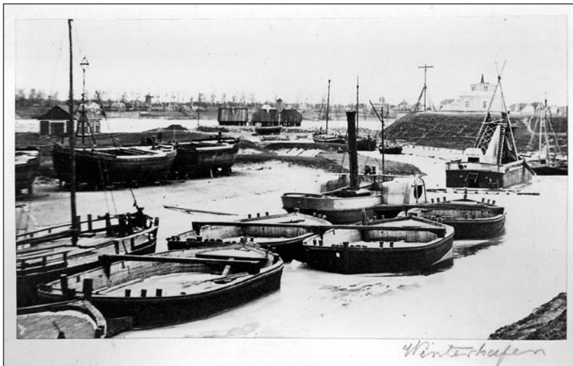
Pärnu talvesadam.

Nähtavasti ei suutnud fotograafia Seidlitzile ja tema perele tihenened konkurents is enam vajalikku sissetulekut tagada. 18. septembril 1869 avas ta kirjutus- ja joonistusvahendite äri, millega liitis veel naiskäsitööpoe. 69 Aastate jooksul kauples Seidlitz väga paljude asjadega (kantseleitarbed, mänguasjad, tapeet, paberlilled, parfüümid, naiste käsitöö esemed jm.) ning võttis lapsi kostile. 1870. aastal nimetas Seidlitz end veel korra fotograafiks, edaspidi tundis pärnulane üksnes