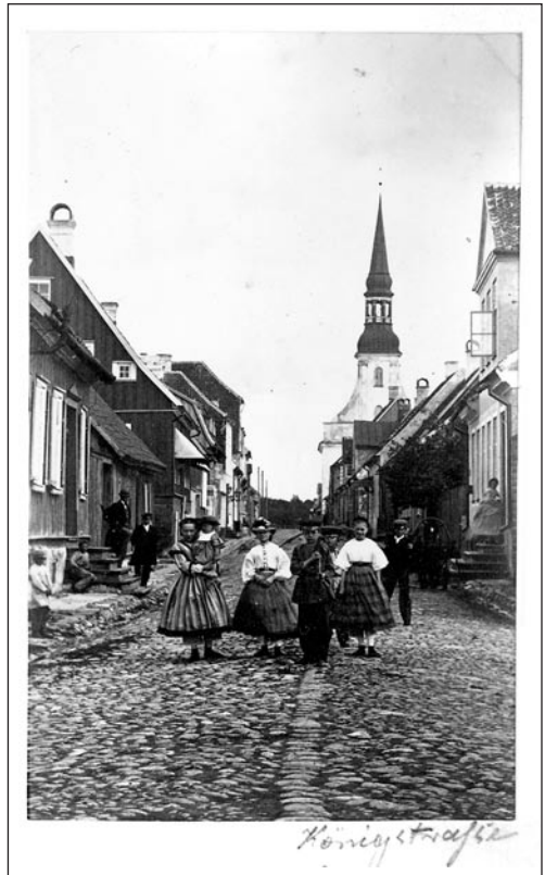
Kuninga tänav. Foto L. Seidltzi Pärnu fotoalbumist (1866). Erakogu

V. Vende on aastakümneid tagasi esitanud üsna kummalise seisukoha, et „fotoajaloo seisukohast ei olegi erilist mõtet vaeva näha iga linna esimese fotograafi väljaselgitamisega. Kui selleks esimeseks ei olnud ka mõni eespool mainituist Lipschütz või Kleinschneck või mõni kolmas, siis veel uute läbireisijate nimed ei lisa meie kultuuriloole eriti midagi.” 3 Muidugi võib fotograafia ajaloole ka niimoodi läheneda, aga see mõtteviis jätab meile üsna palju valgeid laike. Ei saa kuidagi unustada, et need „läbireisijad” tutvustasid meile fotograafia erinevaid võimalusi, korraldasid esimesi näitusi, töid müügiks fototehnikat ja õpetasid pildistamise algtõdesid. Nendest esialgsetest „läbireisijatest” said mitmest hiljem meie linnades pidevat tööd alustanud fotograafid, kes pildistasid esimestena siinseid inimesi, vaateid. Kas need pole siiski küllalt kaalukad põhjused, et nende nn. läbireisijate